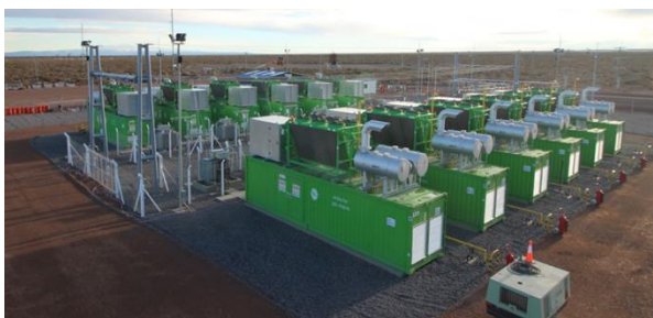
Loma Campana Este

Loma Campana Este se construyó en 6 meses y se inauguró en julio de 2017. El diseño, provisión, construcción, montaje y puesta en marcha de las instalaciones de la Central estuvo a cargo de YPF Luz.